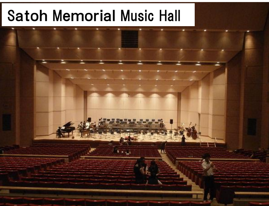
Satoh Memorial Music Hall